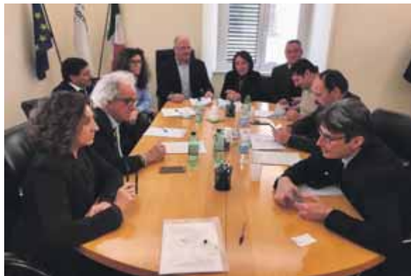
La firma del nuovo contratto collettivo di lavoro applicabile ai professionisti non ordinistici

plementare aperto «Il Mio Domani» e la possibilità di porre in essere interventi in termini di flessibilità attraverso la contrattazione di secondo livello.